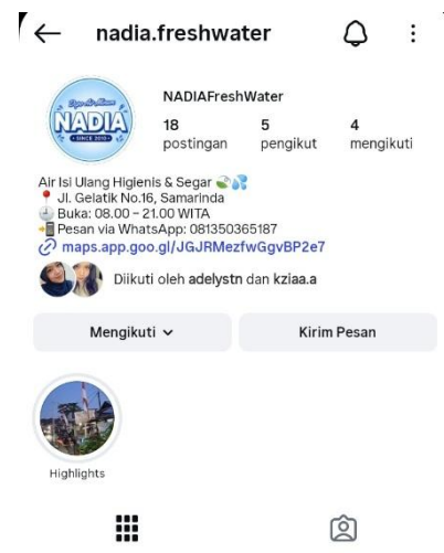
Gambar 2. Tampilan akun Instagram setelah penambahan konten