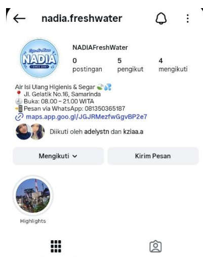
Gambar 1. Tampilan awal akun Instagram sebelum pengunggahan konten